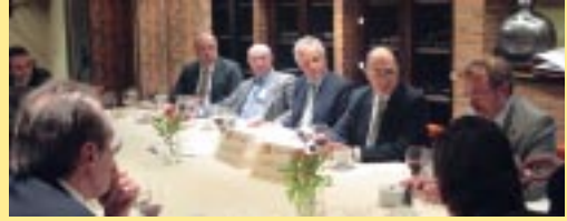
5 de noviembre de 2003 Julián García Vargas Ex ministro de Sanidad y Consumo y ex ministro de Defensa