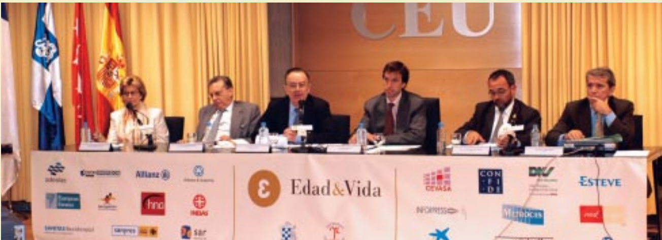
Mesa de la Jornada sobre Dependencia en la Universidad San Pablo-CEU de Madrid