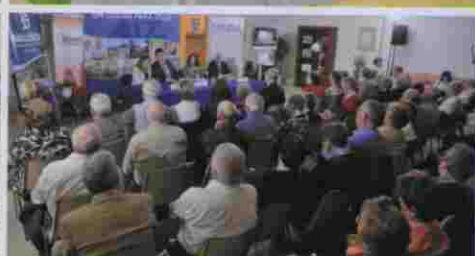
Jornadas Un lugar para vivir

Palabras mayores comenzó a emitir en mayo, de lunes a viernes, en esRadio Madrid2. Pero gracias al éxito de la iniciativa, a la vuelta de vacaciones el programa dio el salto a nivel nacional y, desde septiembre, puede escucharse en toda España, los sábados y domingos, de 7 a 8 de la mañana, a través de las emisoras locales y provinciales de la cadena generalista esRadio.