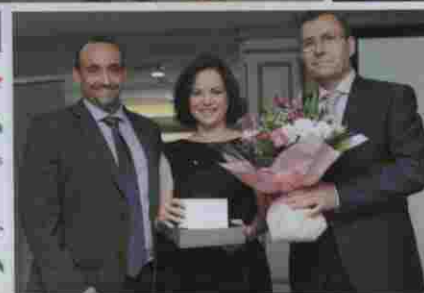
Premio AMADE al Grupo SENDA como mejor medio de comunicación