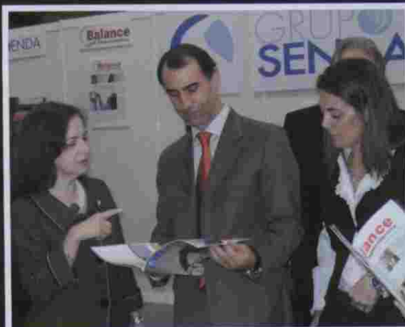
I Congreso De la Autonomía personal a la Dependencia