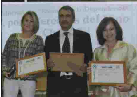
Premio AEEPP al periódico Balance de la Dependencia