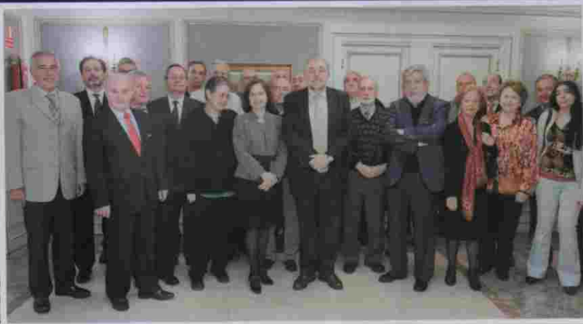
I Foro SENDA

dencia y la revista SENDA para gente activa , ha participado activamente en numerosos congresos y encuentros de interés para el sector de mayores y atención a la dependencia. A continuación, destacamos los más importantes: