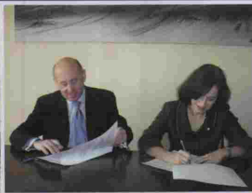
Acuerdo con Grupo Retiro