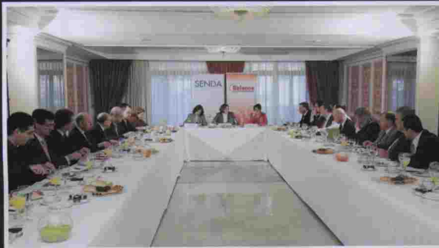
II Consejo Editorial