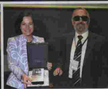
Placa de reconocimiento de SUPPO

y profesionales que se esfuerzan por mejorar la calidad de vida de las personas mayores y dependientes, así como por fomentar la autonomía personal y el envejecimiento activo.