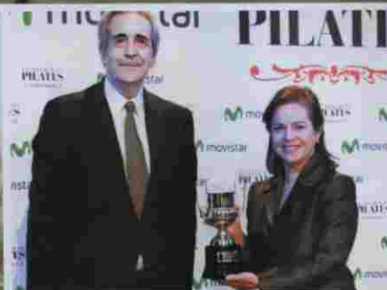
Premio PILATES a la revista SENDA para gente activa